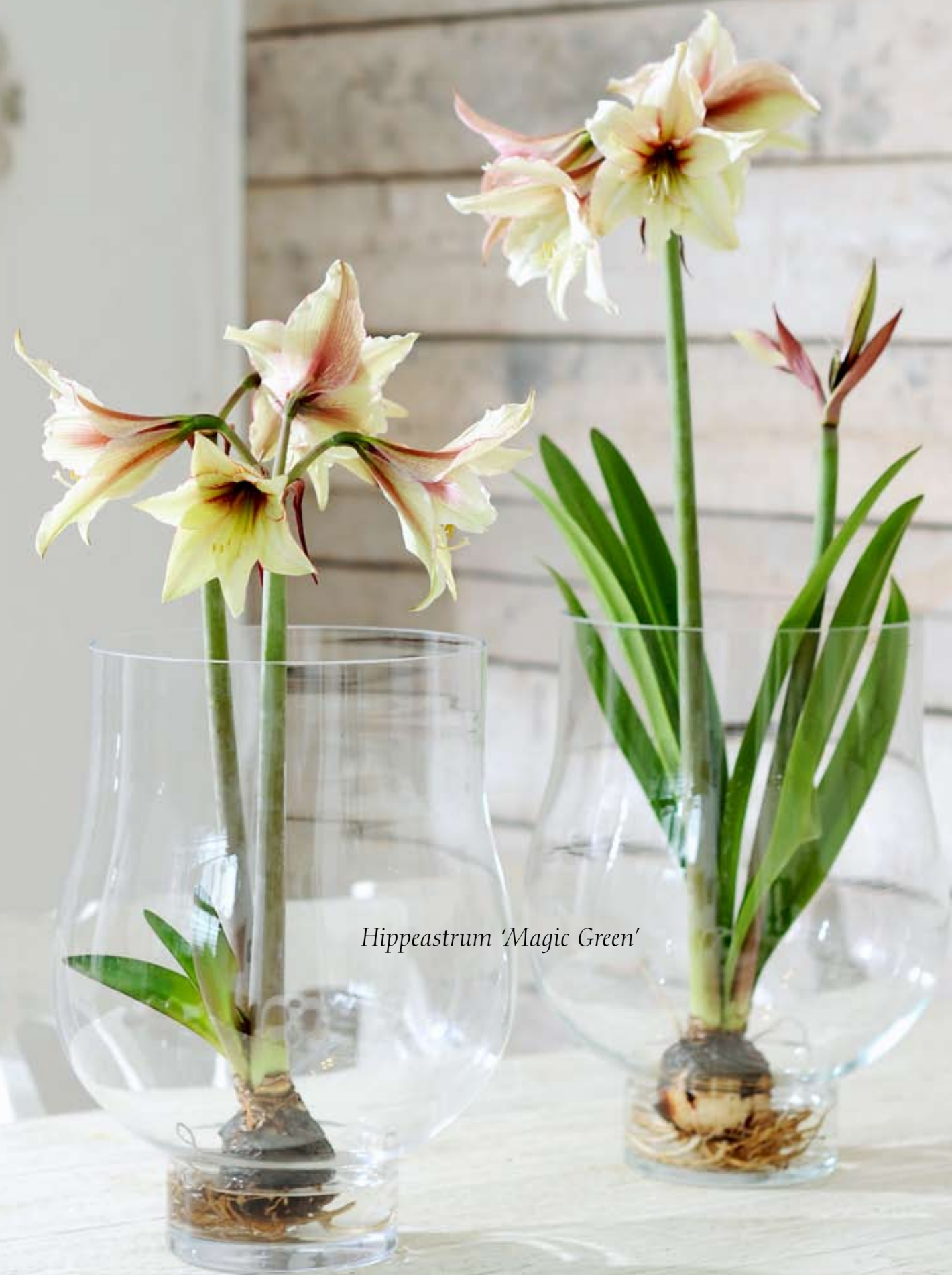
Hippeastrum 'Magic Green'

Glazen vazen, vanaf € 91,50 (Nijhof). Stoelen, vanaf € 186,-, tafel, € 1029,- en wandkandelaar € 61,25 (Veldzicht).